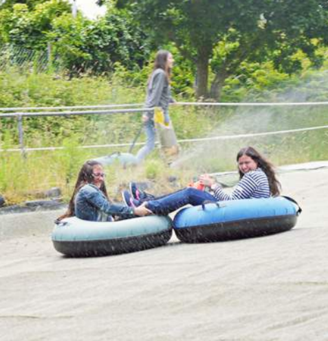
Playa Bovisands Golf Patinaje sobre hielo